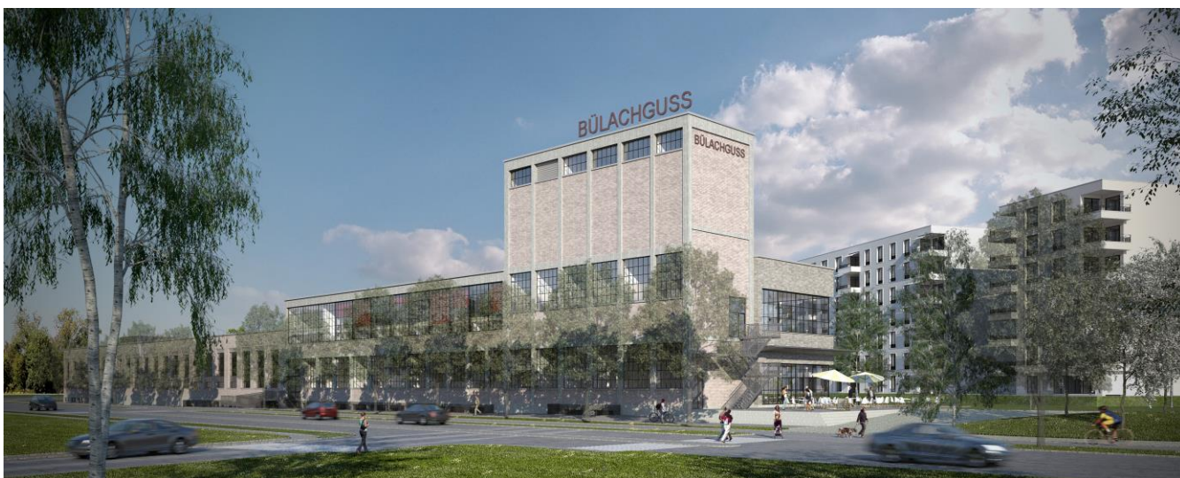
Visualisierung Musikschule Zürcher Unterland und Kulturraum

Bewerbungen für einen freien Raum werden ab sofort entgegengenommen.