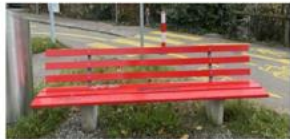
Rote Bülach Bänkli