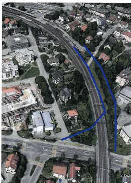
Ansicht Google Earth