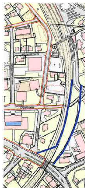
Auszug GIS Kanton Zürich