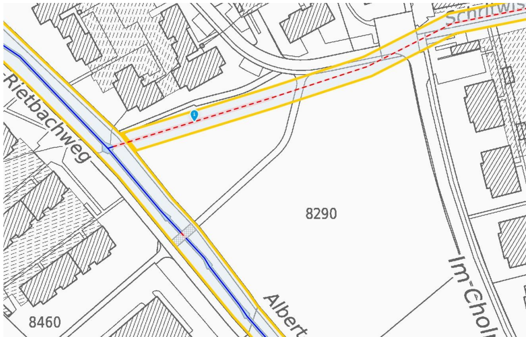
Abbildung 3: Der Gewässerraum durch gelbe Linien dargestellt – innerhalb dieses Streifens ist eine bauliche Nutzung ausgeschlossen.

Die benötigte Fläche für das Projekt kann zu einem späteren Zeitpunkt als anrechenbare Freifläche einer möglichen Überbauung berücksichtigt werden. Mit der Realisierung des Projekts würde die im Rahmen einer späteren Bebauung gesetzlich vorgeschriebene Freifläche zeitlich vorgezogen.