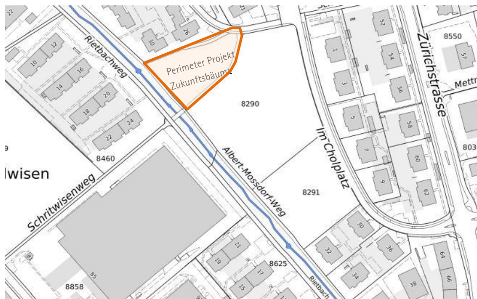
Abbildung 4: Projektperimeter

Der Bereich beschränkt sich auf den Teil der Parzelle nördlich angrenzend an den Schritwisenweg. Die Grösse des Perimeters wurde in der Aussprache am 6. September 2023 vom Stadtrat nochmals bestätigt.