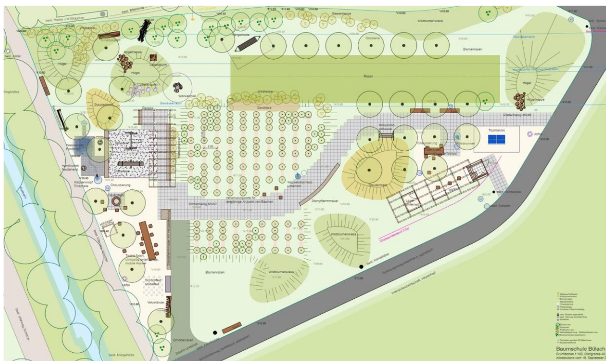
Abbildung 6: Bauprojekt