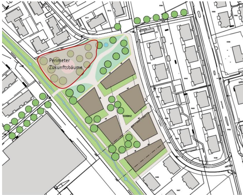
Abbildung 2: Situationsplan einer möglichen Entwicklungsplanung beim Cholplatz, 2009

Aus Sicht des Bereichs Stadtplanung bleibt die Realisierbarkeit der beiden Grundstücke damit gegeben. Das Projekt steht im Einklang mit einer möglichen zukünftigen Bebauung des «Cholplatzes». Die Bau- und Zonenordnung der Stadt Bülach gibt für die Wohnzone W3.0, in der die beiden Parzellen liegen, eine Freiflächenziffer von mind. 0.25 vor. Die Freiflächenziffer sichert Freiräume für Erholung, aber auch für Gärten und weitere Grünflächen auf dem Areal. Diese Fläche wäre mit dem Baugesuch einer Gesamtüberbauung nachzuweisen. Entsprechend müsste bei einer künftigen Entwicklung der beiden Parzellen ein Teil als Freifläche ohnehin bestehen bleiben.